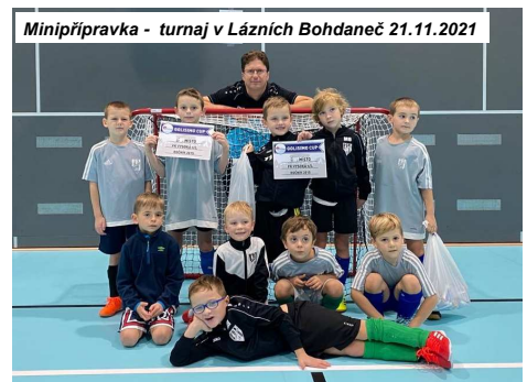
Minipřípravka - turnaj v Lázních Bohdaneč 21.11.2021