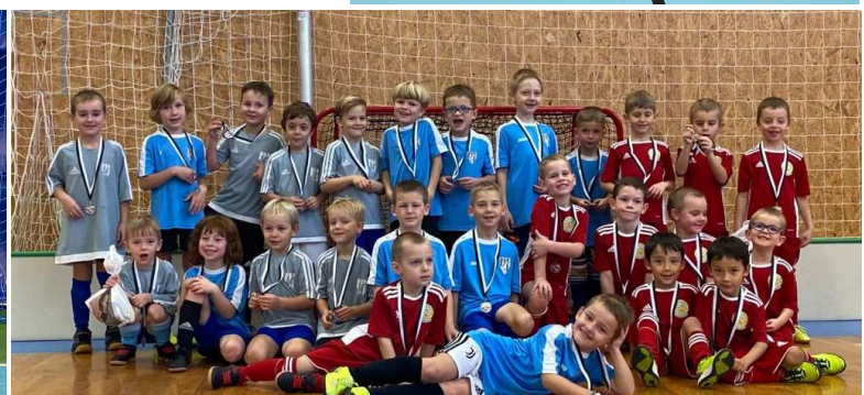
Minipřípravka, zápasy s FŠ FC HK, 28.11.2021