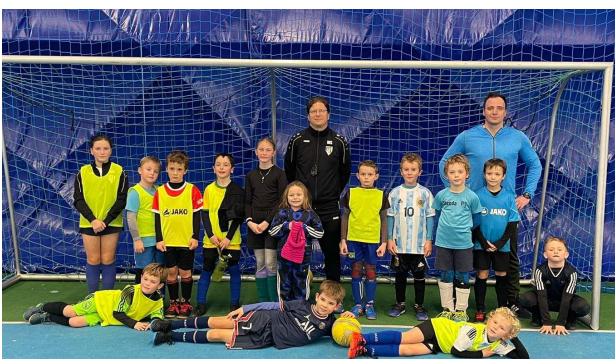
Mladší přípravka po tréninku v nafukovací hale, prosinec 2021