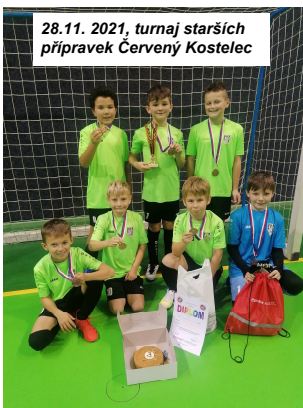
28.11. 2021, turnaj starších přípravek Červený Kostelec

Po nadějně fotbalové podzimní venkovní sezóně, kdy jsme si naplno v září a v říjnu užívali fotbalu