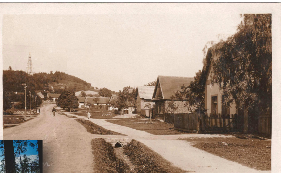
Náves, 30. léta 20. století. Poklidný obraz návsi bez automobilů. Nejblíže dům po pravé straně je Horákovo stavení č.p. 98. V téže podobě stojí dodnes, jen před ním není plůtek a předzahrádka. Malý stromek na návsi kousek nad předzahrádkou je jablko, která stojí dodnes. A dodnes rodí zelená, poměrně kyselá jablka, kterým se říká „štrůdláky“. Na obzoru je kopec Milíř s rozhlednou či spíše trigonometrickou věží. Stráň nad obcí je travnatá, jsou na ní dobře vidět třešňové stromy, z nichž několik se dochovalo do současnosti. V pravé části svahu je světlá skvrna „hliníku“, odkud se těžila opuka a rozvázela se do polí. Silnice a chodníky jsou zpevněné pouze „vysočkým pískem“ z písníku nad obcí. Hluboké příkopy byly nahrazeny kanalizací v 70. letech 20. století.