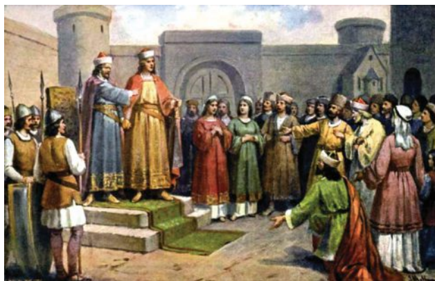
Kníže Jaromír předává vládu Břetislavovi.

Významnými a vlivnými rody na českém území té doby jsou i Vršovci a Slavníkovci. Ti sídlí na Libici, bohatém a dobře opevněném hradišti,