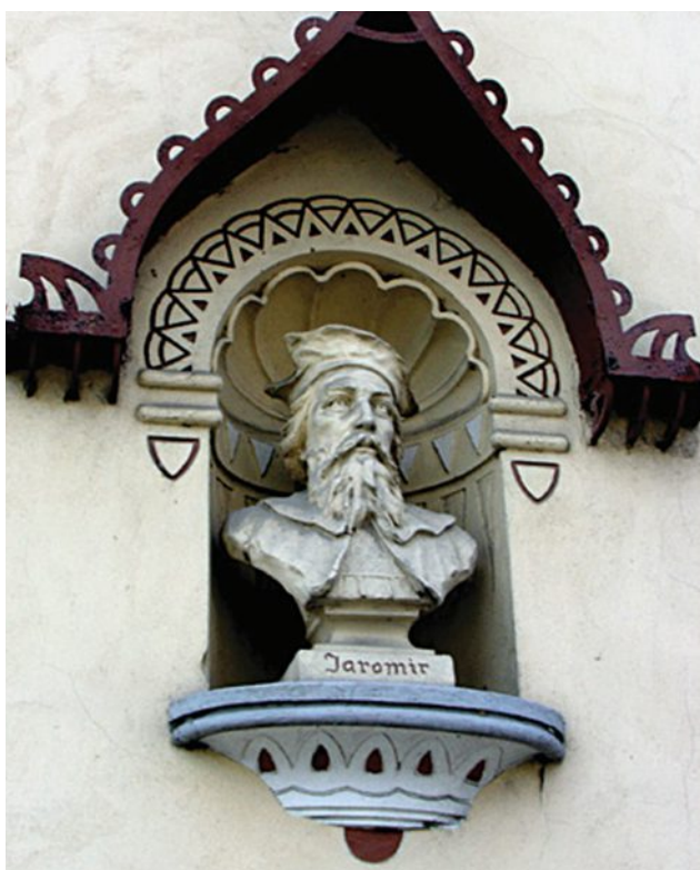
Busta knížete Jaromíra nad jaroměřskou bránou.

Boleslav svévolně vede války, jeho chtivost nezná mezí. Ke svým vazalům, poddaným i příbuzným je krutý, bezohledný a ke všemu odhodlaný. Umírněný Jaromír je dobrý vojevůdce a taktik, který nemá výbojnou povahu svých bratrů, avšak není proto méně významný. Nejmladší Oldřich je rázný, schopný a často jedná bez zábran. Vyzná se v boji a nesváry v rodině i s nepřáteli řeší nekompromisně. (Nejsou známa všechna fakta, z některých pramenů vyplývá, že vedl i krvavou řež na Libici.)