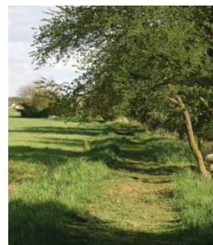
Ve švestkách – srovnání před a po