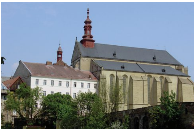
Kostel sv. Mikuláše v Jaroměři stojí na místě starého přemyslovského hradu.

Drsná vláda tohoto Přemyslovce však v dalších letech překračuje všechny přijatelné zvyklosti a obvyklou míru tvrdosti. Oldřich postupně ztrácí věrnost svých přívrženců i ochotu dvorského prostředí ke spolupráci. Šlechta se bouří, též Oldřichův syn Břetislav hledí na Moravě provádět samostatnou politiku a nevázat se na pražské prostředí svého otce. Roku 1034 kníže Oldřich sedí v bavorském vězení, kam ho nechal uvrhnout císař Konrád II. za spolčování s nepřitelem. S odstupem času pak císař Oldřichovi uděluje milost, s podmínkou, že se s Jaromírem v Čechách o vládu podělí.