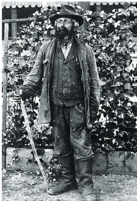
Kohlenteufel - strašák hostinských dětí

Další postavíčkou z městského chudobince a bez jména, byl malý vyzábělý mužíček, který chodil po městě a žebrol. Na hlavě nosil starou ošoupanou kšiltovku s kokardou a při prosbě o nějaký ten krejcar vždy salutoval. Pokud skutečně drobný peníz obdržel, tak vždy pronesl stejná slova: „Glück