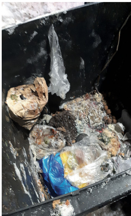
Fotka ze svozu biopopelnic dne 13. ledna 2026

Bioodpad je často vyhazován v igelitových nebo plastových sáčcích, které do hnědých popelnic nepatří.